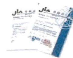
ISO50001(EnMS)を活用した エネルギー管理