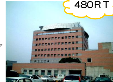
河内長野市役所様