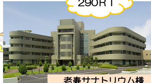
老寿サナトリウム様