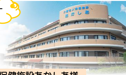
老人保健施設あかし様