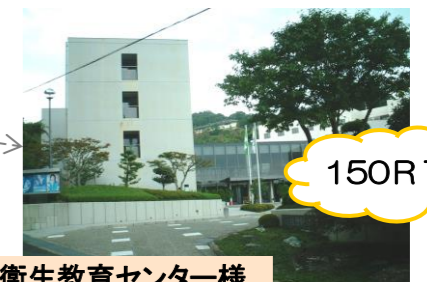
安全衛生教育センター様