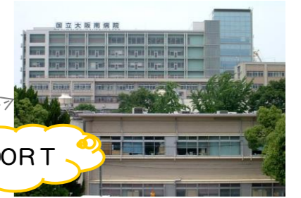
大阪南医療センター様