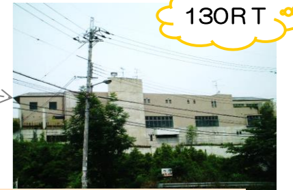
グルメ杵屋河内長野荘様