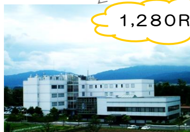
日本農業(株)総合研究所様