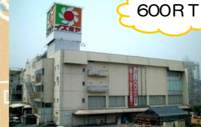
イズミヤ(株)河内長野支店様