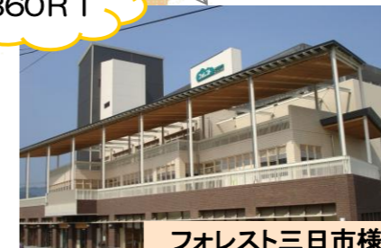
フォレスト三日市様