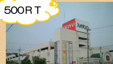
河内長野ショッピング デパート様