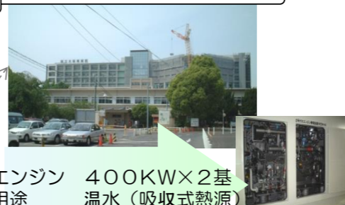
大阪南医療センターさま