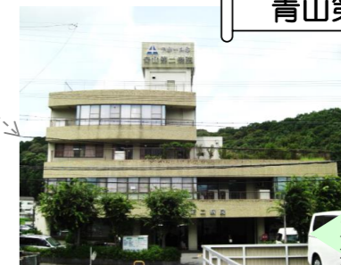
青山第二病院さま