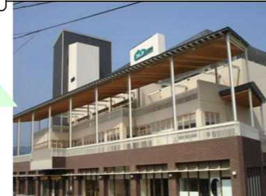
ウェルネスフォレスト三日市さま