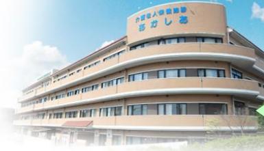
老人保健施設あかしあさま