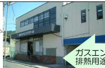
菊水スイミングスクールさま