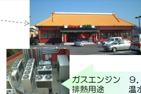
カルピの王さま河内長野店さま