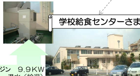
学校給食センターさま