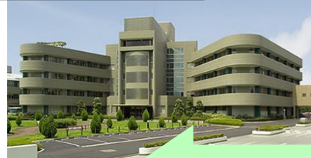
老寿サナトリウムさま