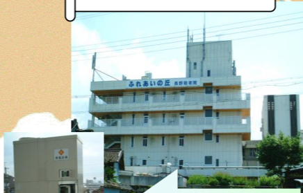
ふれあいの丘 長野敬老院さま